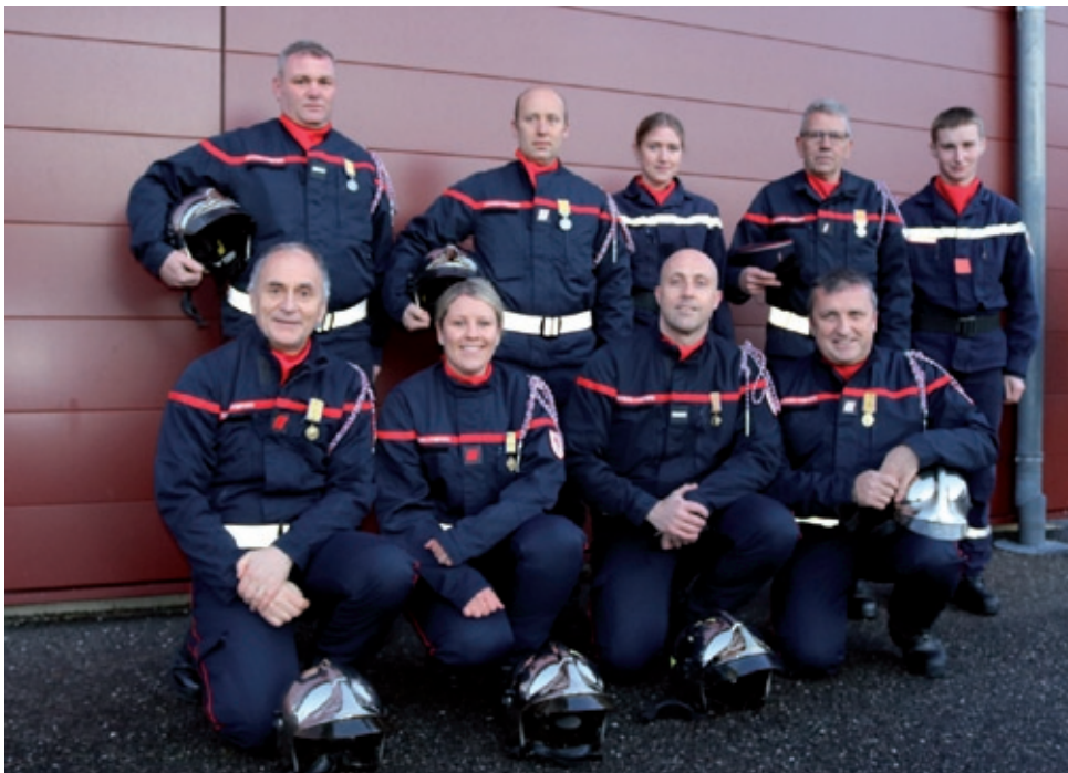
Distinctions et promotions de grades chez nos sapeurs-pompiers