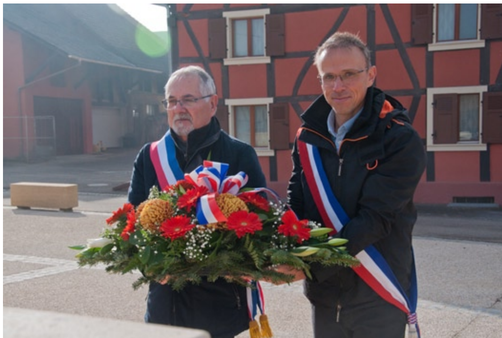
11 novembre : dépôt de gerbe au monument aux morts

Le conseil municipal approuve le programme de réfection de la rue de la vallée et désigne le bureau d'étude IRH de Colmar comme maître d'œuvre de l'opération pour un montant d'honoraires de 13 650 € HT.