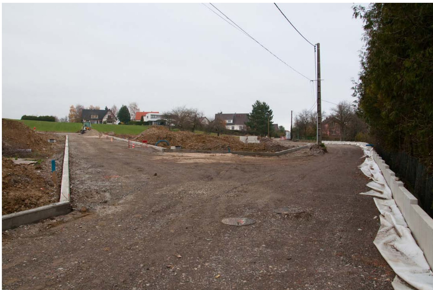
Les travaux vont bon train dans le lotissement du Rabhebel et dans la rue du bosquet