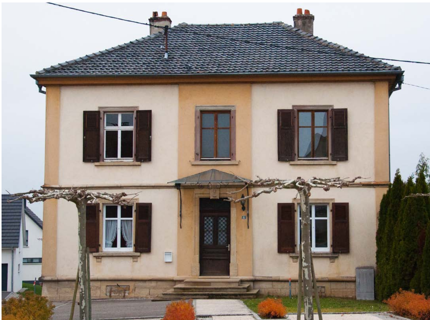
Le presbytère est appelé à devenir la nouvelle mairie.