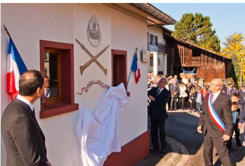
Inauguration du Firspretzihisle rénové