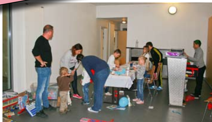
Le coin réservé aux enfants lors de la collecte