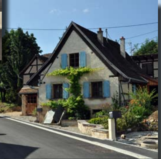
Des chantiers qui se terminent..