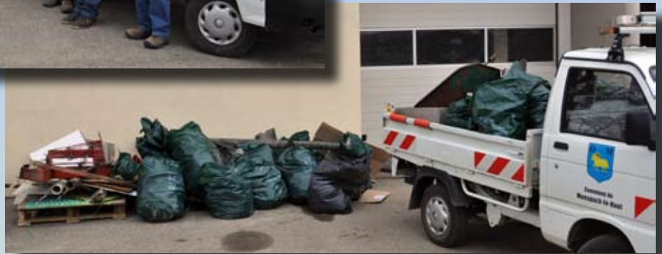
... et le butin de la matinée !