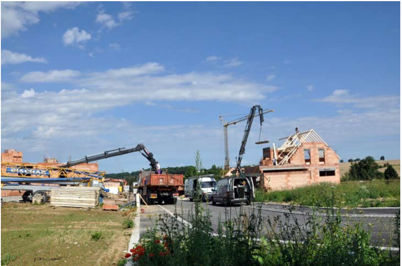
Les grues ont pris possession du lotissement du Clos des vergers