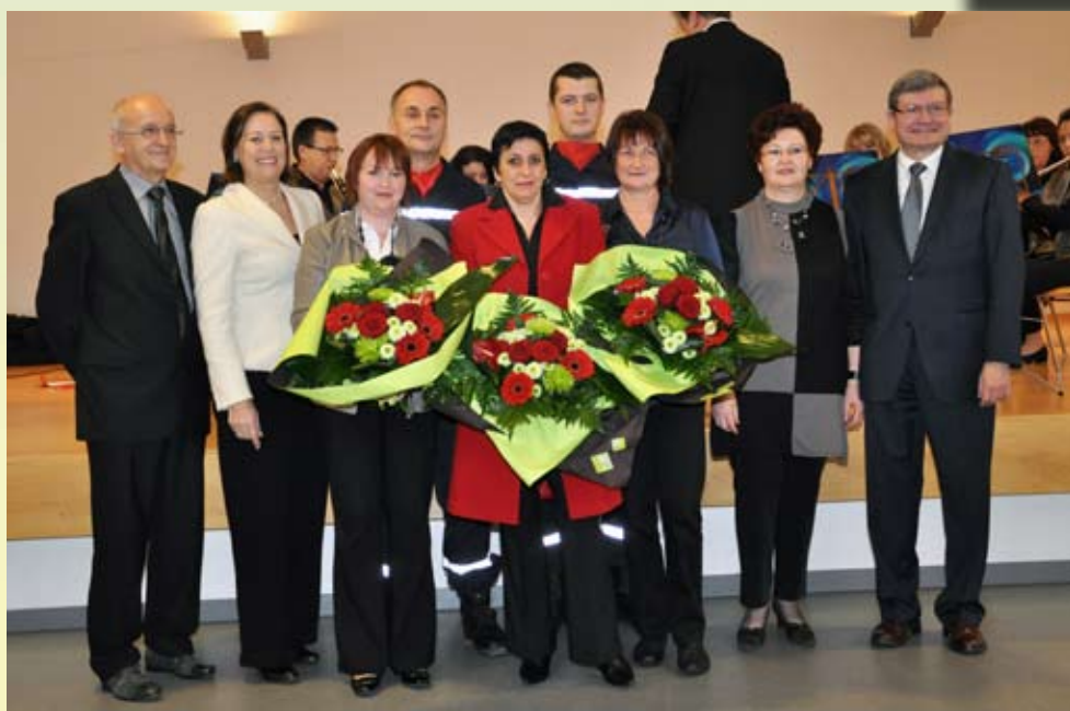
Lors de la réception du nouvel an, les personnalités et les personnes mises à l'honneur