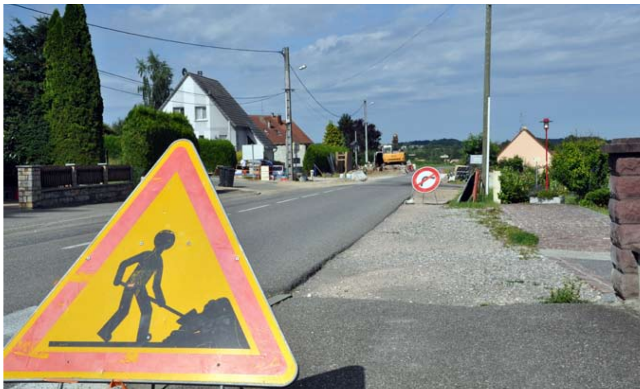
Chantier d'assainissement dans la rue de Delle : la patience sera une nouvelle fois de mise cet été