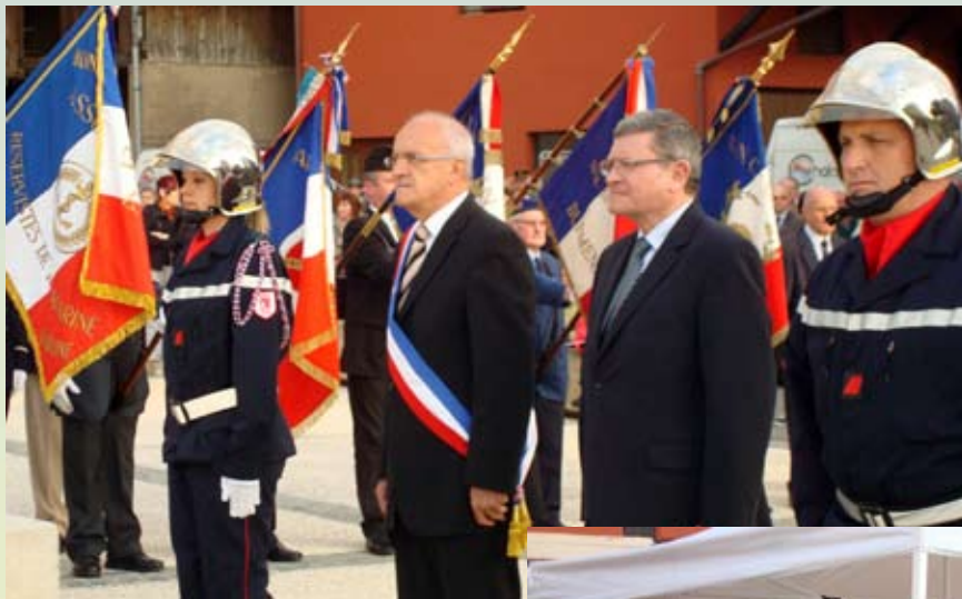
Cérémonie commémorative du 8 mai 1945