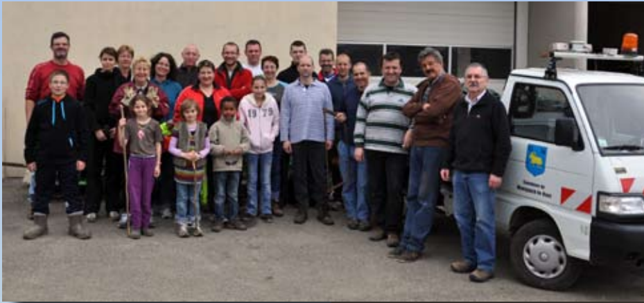
Les bénévoles qui ont participé à l'opération Haut-Rhin propre...