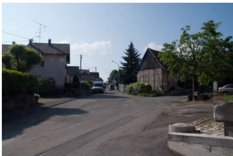
Début mai, le chantier de la rue Saint-Georges est sur le point d'entrer dans sa phase active