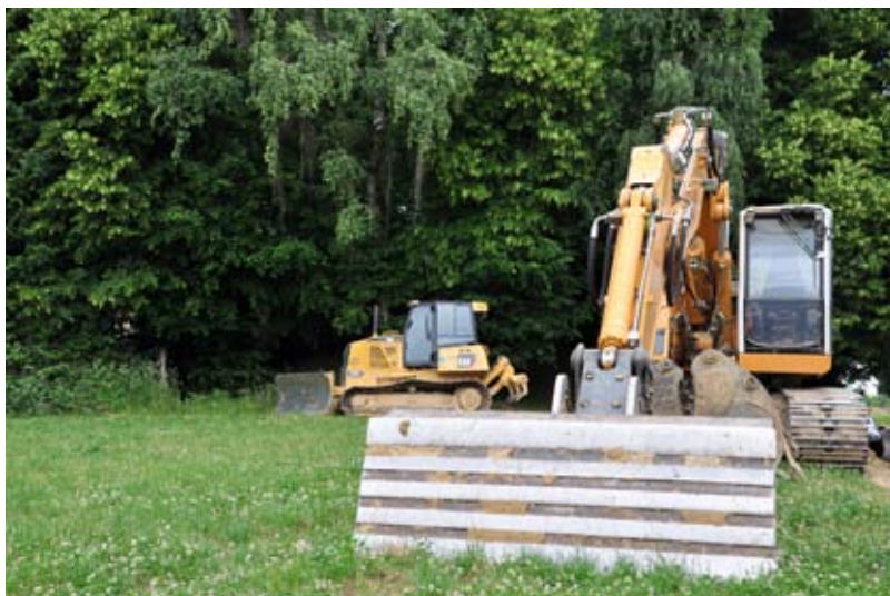
Début juin, c'est sur le chantier du futur réservoir que les engins de terrassement se mettent en action

Le Conseil municipal approuve la constitution d'une servitude sur chacune des parcelles énumérées au profit de la Communauté de communes Ill et Gersbach et autorise Monsieur le Maire à signer l'acte de constitution des servitudes.