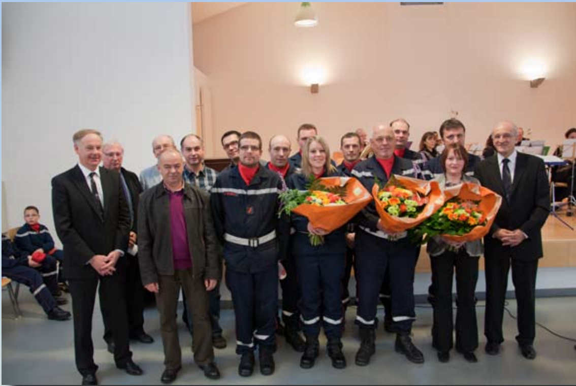
Les donneurs de sang, les sapeurs pompiers promus et les quêteuses au profit de la recherche contre le cancer entourés par les personnalités lors de la réception du nouvel an, le 9 janvier