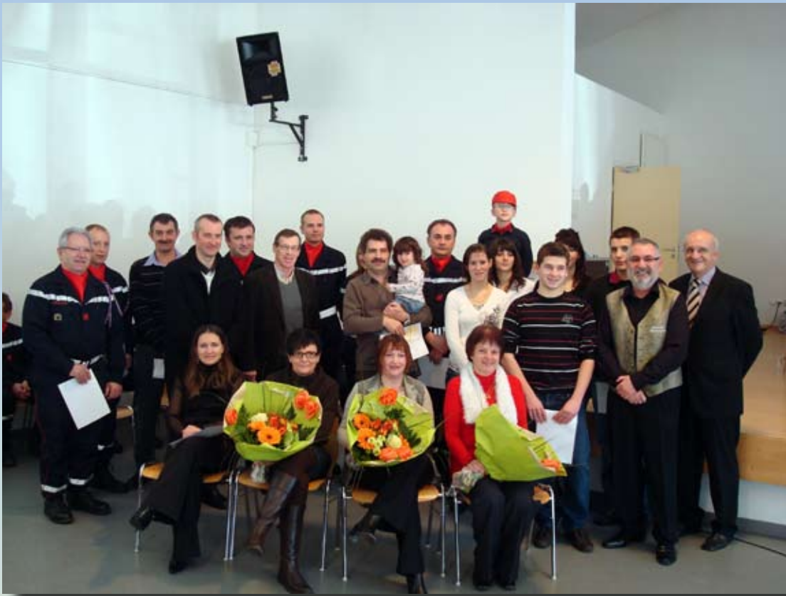
Réception du Nouvel An, le 3 janvier 2010 : pompiers et donneurs de sang diplômés