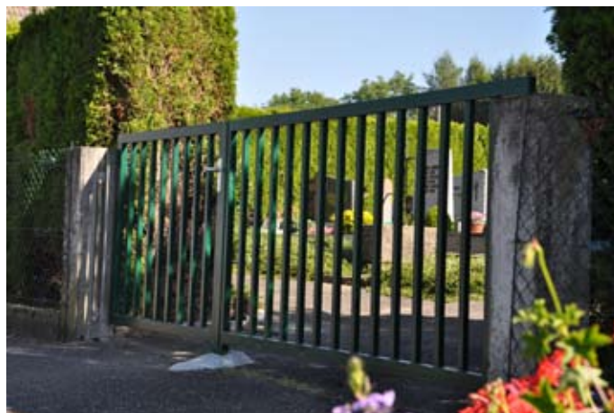
L'ancien portail en aluminium du cimetière a été remplacé par un modèle en acier

Le Conseil Municipal approuve cette facture.