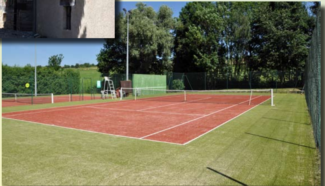
Après le terrain de football, voici maintenant des courts de tennis en gazon synthétique, pour le plus grand bonheur des licenciés du TC Muespach-le-Haut