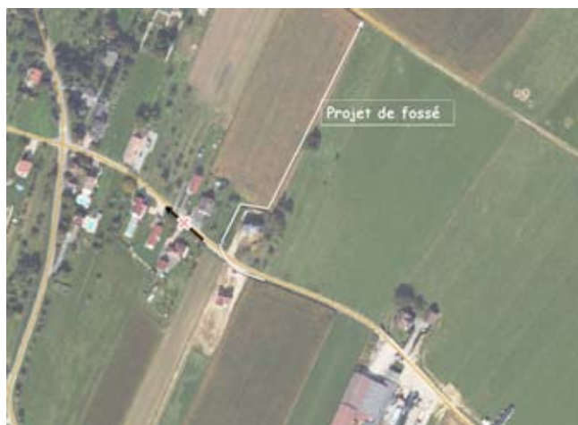
Le GERPLAN prévoit la création d'un fossé entre la rue des prés et le prolongement de la rue des Landes afin de prévenir les risques d'inondation dans la rue des prés

afin de savoir s'il est possible de construire une maison d'habitation sur les parcelles cadastrées section 2 n° 398/14, 401/15, 397/14 et 400/15 de 1386 m 2 , située rue de la Diligence : terrain situé en partie en zone Nab, il est signalé qu'une participation pour voie et réseau est instituée