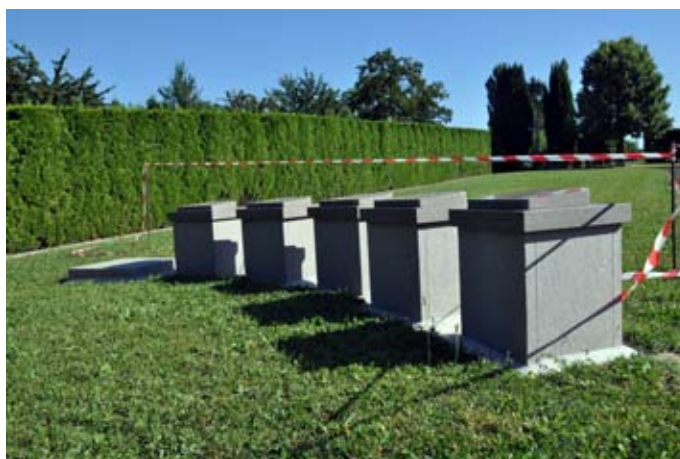
Le projet de columbarium est en cours de réalisation : le monument et les aménagements paysagers sont programmés pour cet été

Le Conseil Municipal approuve les travaux de création d'un columbarium pour un montant de 9 431,00 € HT soit 11 279,47 € TTC et décide de confier les travaux à l'entreprise Zanchetta de Village-Neuf. Il approuve également le programme d'aménagement paysager pour un montant de 4 754,50 € HT soit 5 686,38 € TTC et décide de confier les travaux à l'entreprise Springinsfeld de Durmenach.