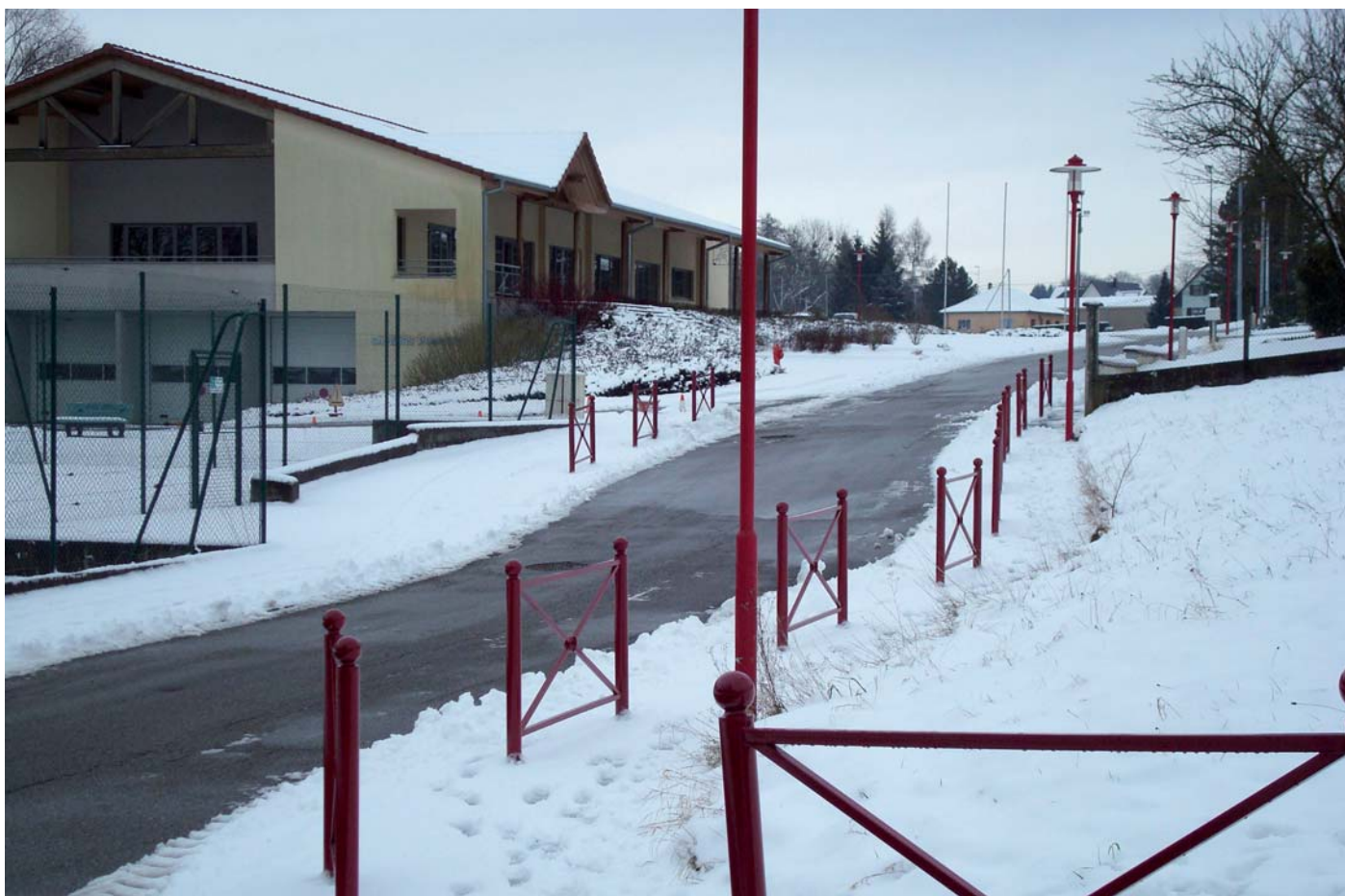
Grâce aux barrières mises en place dans la rue du stade, le véhicule des pompiers ne sera plus gêné pour sortir, même lorsque de nombreux véhicules stationnent aux abords de la salle

La fête de Noël des personnes âgées se déroulera le dimanche 6 décembre 2009. Les membres du Conseil en charge des invitations passeront au domicile des personnes concernées le samedi 21 novembre 2009. Un courrier sera envoyé à tous les invités.