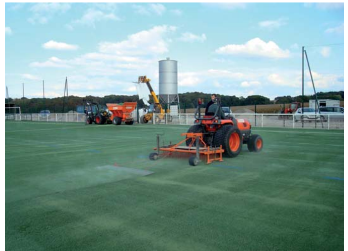
...puis vient le remplissage, avec du sable siliceux d'abord, puis avec des granulés de caoutchouc.

Tous, joueurs et bénévoles, ont parfaitement conscience des efforts considérables consentis par les deux communes pour nous doter de ces équipements. Nous savons que nous n'avons pas le droit de décevoir ceux qui nous ont fait confiance et nous ferons tout pour que cela n'arrive pas.