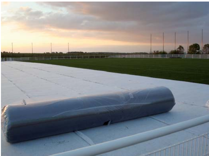
Le tapis d'herbe synthétique est déroulé sur la sous-couche...

Dès la reprise, fin janvier pour les seniors et mi-février pour les jeunes, tous les entraînements et tous les matchs se dérouleront sur ce nouveau terrain.